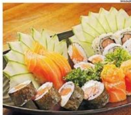
NO YABOO Culturalia Oriental, haverá modinha dupla de sushi e sashimi

Uma das casas que está com oferta é o Yaboo Culturalia Oriental, em Jardim Camburi, no capital. Hoje, das 16h30 às 23h, há modinha dupla de sushi e sashimi, incluindo temaki, hot, nigiri, gunkan