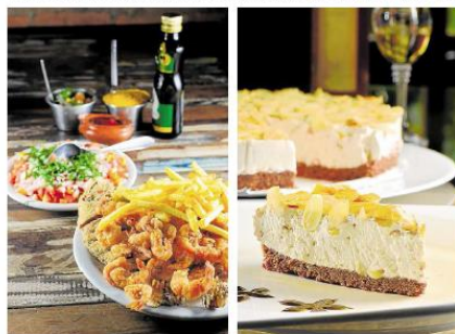
Gastronomia oriental, mariscos, sobremesas, cozinha italiana, culinária de boteço: há opções de descontos, brindes e cortesias em casas espalhadas por todo o Espírito Santo

Com êxito: as informações publicadas neste caderno estão sujeitas a alterações, conforme o movimento de público e o design do estabelecimento. Sugerimos que você ligue para o seu destino, antes de sair de casa, e cheque horários e valores publicados.